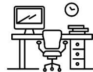
Ergonomische und grosszügige Arbeitsplätze