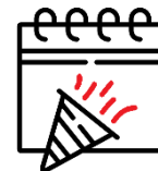
Ausflüge und Events