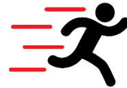
SUHNER-Fit + The Gym