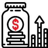
Ausgezeichnete berufliche Vorsorge