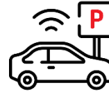
Gratisparkplätze am Arbeitsort