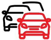
Nutzung der Firmenpoolfahrzeuge inkl. Flottenrabatte