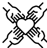
Diverses und offenes Arbeitsklima