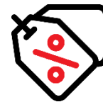
Brands for Employees